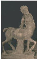
Le Centaure âgé Bronze Copie d'un bronze romain du 1er siècle ap J.-C Roma - Fonderie Nelli