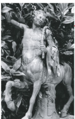
Le Centaure jeune Bronze - (disparu) Copie d'un bronze romain du 1er siècle ap J.-C Roma - Fonderie Nelli