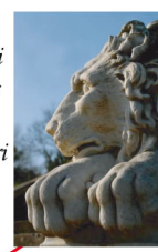
Les Lions Marbre blanc Copies d'originaux de 1792 de Canova Basilique Saint-Pierre Roma - Ernesto Gazzeri