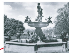
La fontaine d'Apollon Bronze et marbre blanc Roma - Fonderie Nelli