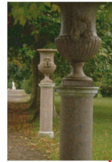
L'exèdre Marbre blanc granite rose Roma Ernesto Gazzeri