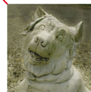
Les chiens - Molosses Cerbères en marbre blanc Copies d'originaux grecs du IVe siècle av J.-C Roma - Ernesto Gazzeri