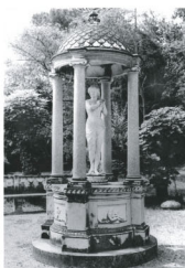
Le Temple de l'Amour Marbre blanc - granite rose La vénus a été volée en 2007 Roma - Ernesto Gazzeri