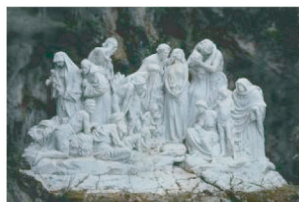
Le Mystère de la vie Marbre blanc Oeuvre originale Roma - Ernesto Gazzeri