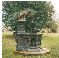
Le Puits au lion Bronze Roma - Fonderie Nelli