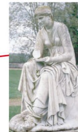
La Muse Calliope Muse de la poésie Marbre blanc Copie d'un marbre grec du IIe siècle av J.-C non signé